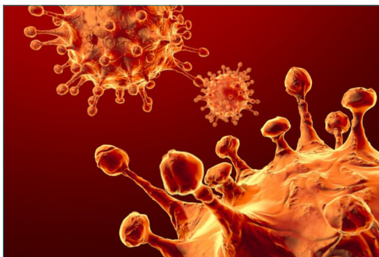
Figura 5.1. La struttura del coronavirus SARS-CoV-2, in una illustrazione 3D

Molti coronavirus possono essere trasmessi da persona a persona, di solito dopo un contatto stretto con un paziente infetto, ad esempio tra familiari o in ambiente sanitario. Anche il nuovo coronavirus responsabile della malattia respiratoria COVID-19 può essere trasmesso da persona a persona tramite un contatto stretto con un caso probabile o confermato.