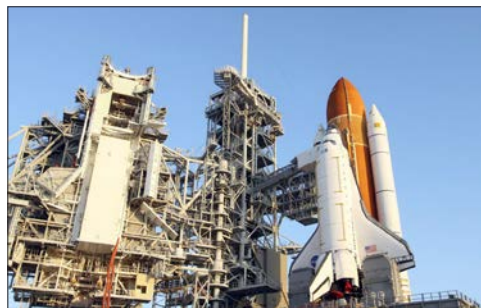
Figura 1.4. Pallone a struttura geodetica e piattaforma di lancio del Columbia