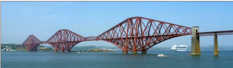
Figura 1.1. Veduta del ponte Forth Bridge

Il primo ponte costruito interamente in acciaio fu il Forth Bridge in Gran Bretagna tra il 1883 e il 1890. La grande quantità di acciaio necessario fu disponibile grazie al processo Martin-Siemens sviluppato nel 1875 che produceva acciaio di uniforme qualità. Per la realizzazione del ponte che lega le sponde tra Inchgarvie e Fife nella città di Edimburgo in Scozia furono necessarie 64.800 tonnellate di acciaio fornite da due acciaierie in Scozia e in Galles.