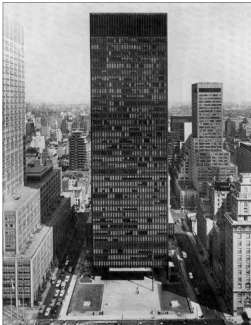
Figura 1.3. Mies Van de Rohe. Seagram Building – New York, 1958

L'acciaio conquista subito il modo di costruire gli edifici d'America per le sue straordinarie possibilità di svilupparsi in altezza. Nel 1958 a New York City, l'architetto tedesco Ludwig Mies van der Rohe in collaborazione con l'americano Philip Johnson realizza il Seagram Building. Si tratta di un grattacielo ubicato al n. 375 di Park Avenue, tra la cinquantaduesima Strada e la cinquantatreesima Strada, nella Midtown Manhattan.